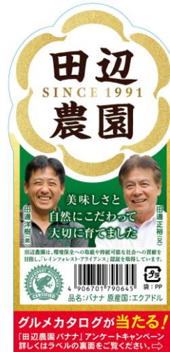
キャンペーン告知ラベル(左:表、右:裏面応募要項)